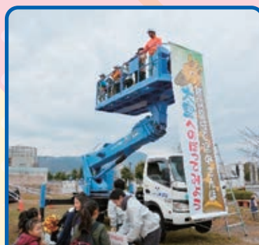
高所作業車乗車体験