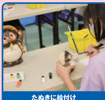
たぬきに絵付け 職人・アーティスト体験