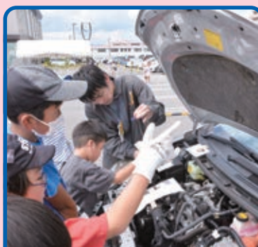
自動車整備士の仕事体験