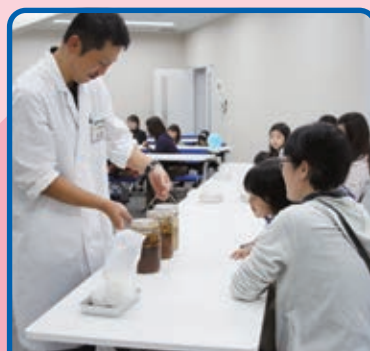
手作りポン酢体験