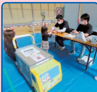
トラックのお仕事体験