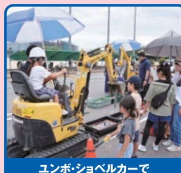
ユンボ・ショベルカーで スーパーボールすくい体験