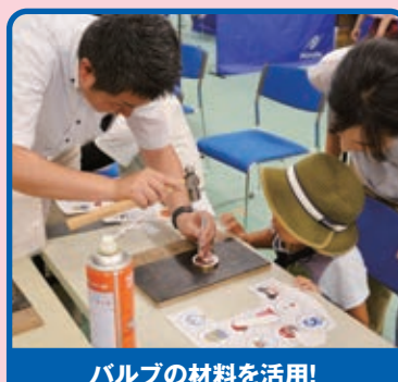
バルブの材料を活用! メダル製作体験