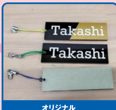
オリジナル ネームプレート製作体験