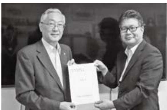
県土木交通部長への要望