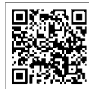
マンガ キャリア人材バンク