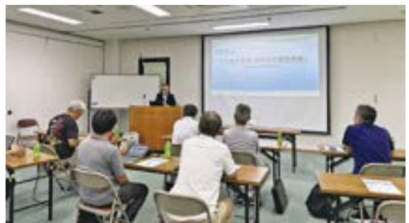
セミナー会場の様子