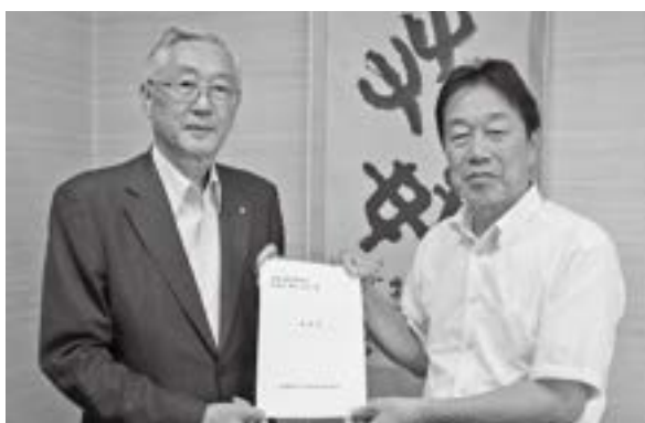
県教育長への要望