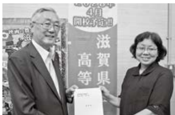
県総合企画部長への要望