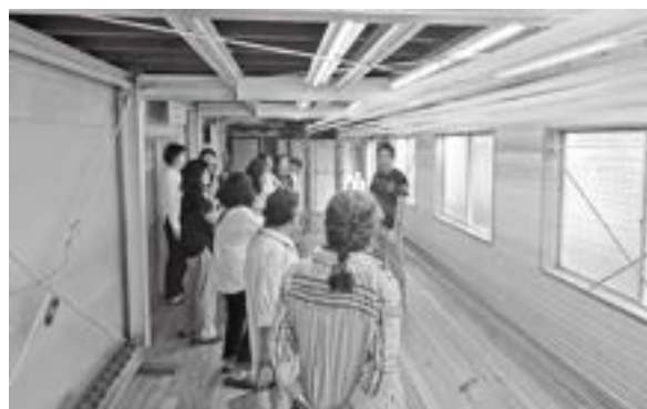
丸三ハシモト株式会社での見学会の様子(しなや華塾)