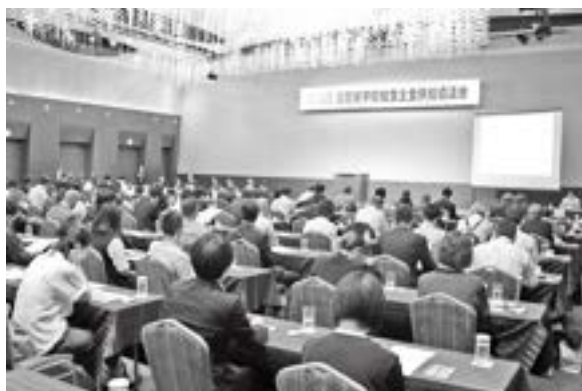
協議会の会場風景