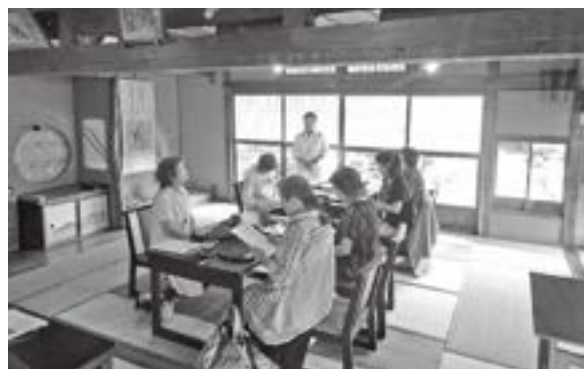
想古亭 源内での見学会の様子(しなや華塾)