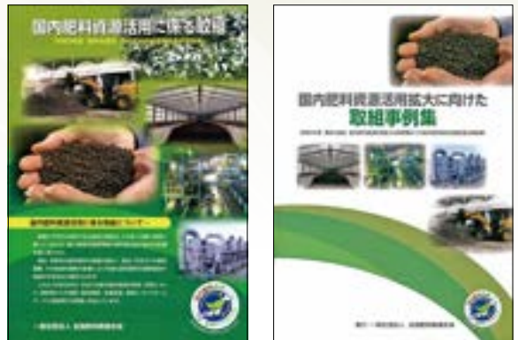
全国肥料商連合会の取組資料