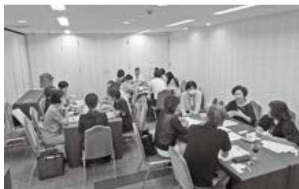
グループワークの様子(懇談会)