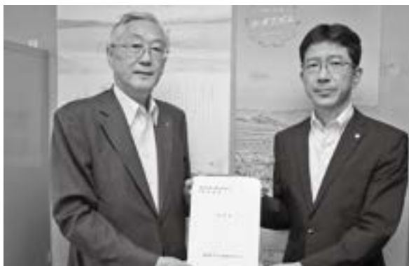
県商工観光労働部長への要望