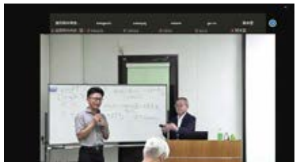
セミナー配信の様子

*Vehicle to Home: 「Vehicle(車)からHome(家)へ」を意味する言葉で、電気自動車(EV)と家庭を繋ぐ仕組み・システムのこと。