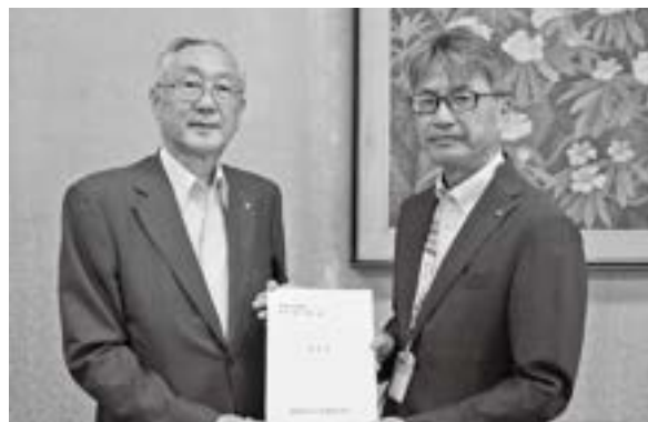
県総務部長への要望