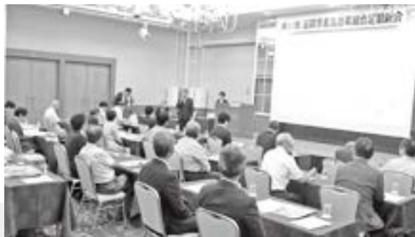
セミナーの会場風景

滋賀県書店商業組合 http://www.shigashoten.sakura.ne.jp/