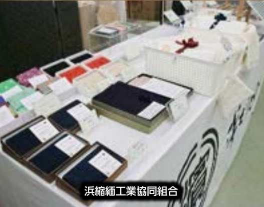
浜縮緬工業協同組合