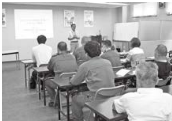
セミナー開催の様子

今後、組合が作成したエコドライブ推進パンフレットを車検整備後の乗用車等に配付し、エコドライブの推進により、組合事業活動全体において2050年までの滋賀県内CO 2 排出量実質ゼロの取組に協力・貢献されていきます。