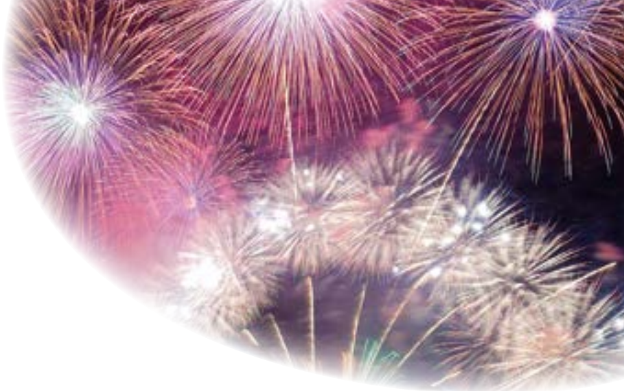
大津市：びわ湖大花火大会