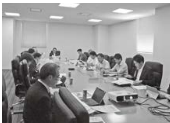
総合・組織連携専門委員会

特に官公需については、県内・地元業者を優先させるべきという意見が多くの委員から寄せられ、円安や物価高騰等を反映した適正な価格での発注と併せて要望に盛り込まれました。