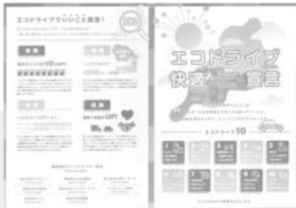
エコドライブ推進パンフレット