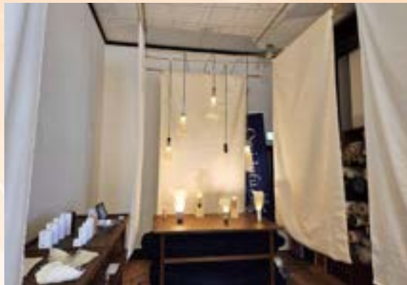
生平で製作されたランプシェード