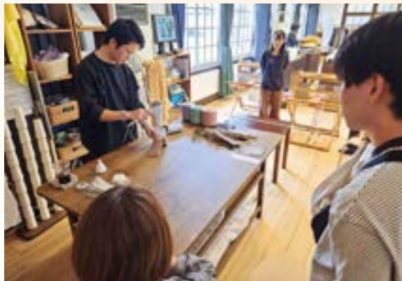
6月9日のワークショップの様子