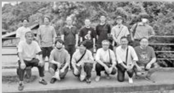
研修会の際の集合写真

これからも歴史ある信楽焼の振興と地域の活性化に向けて全部員一丸となって活動してまいります。