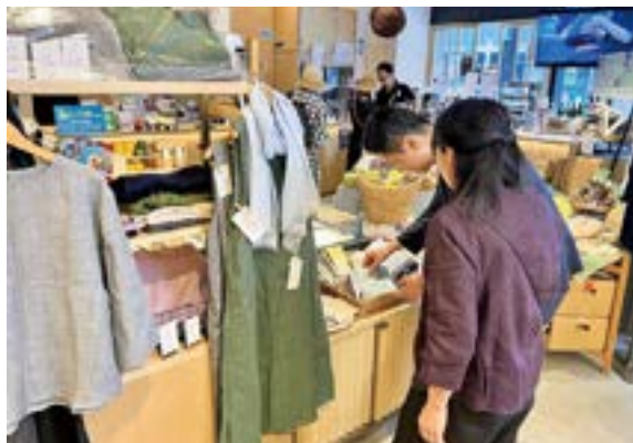
ここ滋賀・販売会の様子