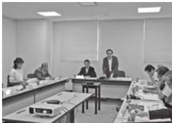
金融・税制・情報化専門委員会

また、コロナ対策の特別融資等の元金返済開始に原材料価格の高騰も重なって中小企業等の資金繰りが益々厳しくなることが金融施策拡充を要望する背景として具体的に記載されました。