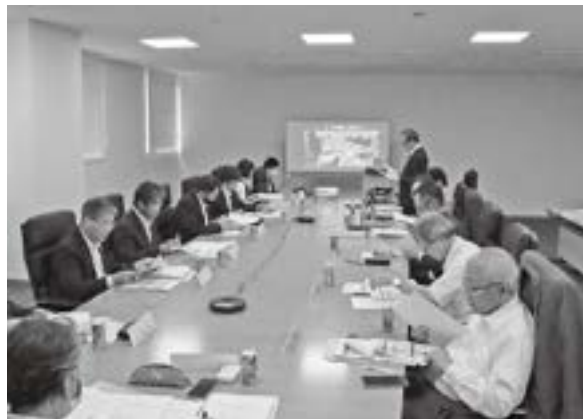
流通・環境・労働専門委員会

特に外国人材を含めた人材確保、事業承継、価格転嫁について重点的に意見交換が行われた結果、労務費を価格転嫁できる環境の整備や事業承継に関する支援の拡充が要望に追加されました。