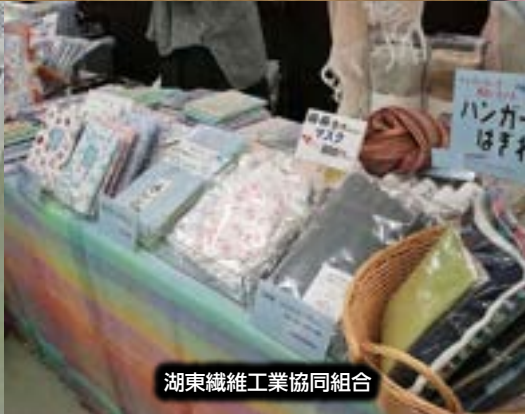
湖東繊維工業協同組合