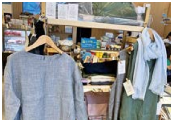
販売された麻の製品

イベントや記念事業、研修会開催、社会貢献活動など、組合様の特徴ある活動について情報をお寄せください。