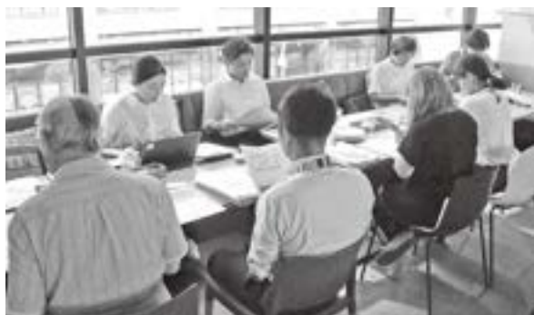
事業説明会の様子

スポットになると、お客さんが「商店街」とつながったり、誰かの役に立てるような「体験」をスマホを使って、いつでも自由につくることができますので、導入を検討されてはいかがでしょうか。