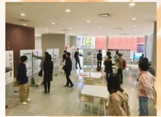
R-GAP 「プロジェクトリサーチ」とは？